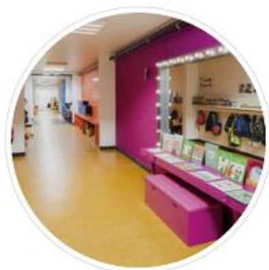
Thuiskomen in de school

Tijdens de creatieve workshops kwamen al heel wat ideeën naar boven borrelen. Ontdek ze hieronder en laat je inspireren! Kriebelt het om mee te doen met Thuis in Gavere? Verken onze lopende projecten laat ons weten wat jou precies interesseert door je aan te melden.