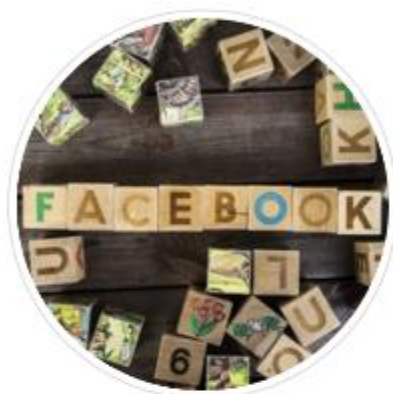
Samen door de dag @Gavere